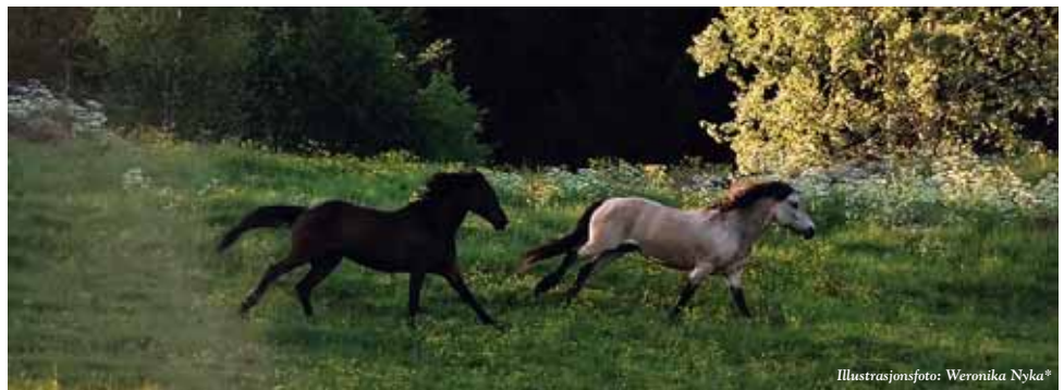
Illustrasjonsfoto: Weronika Nyka*